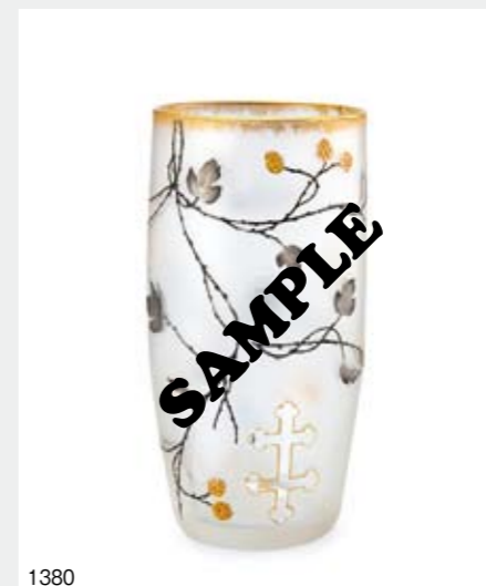
1380 ドーム ホップとローレーヌ十字文グラス H12.3cm 酸化腐蝕彫り、エナメル彩、金彩 底部に金彩サイン ¥ 100,000-150,000 1381 ドーム アイリス文花瓶 H12.1cm 酸化腐蝕彫り、グラヴユール、金彩 底部に金彩サイン ¥ 100,000-150,000