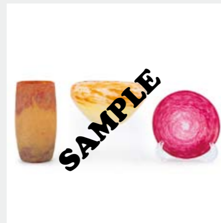
1369 ドーム 他 [3点セット] ガラス器各種 ドーム：ガラス/H12.2cm ヴィトリフィカシオン 側部にエナメル彩サイン シュナイダー：鉢/ H6.3×D12.2cm 皿/D10.7cm 各側部に陰刻サイン ¥ 30,000-50,000