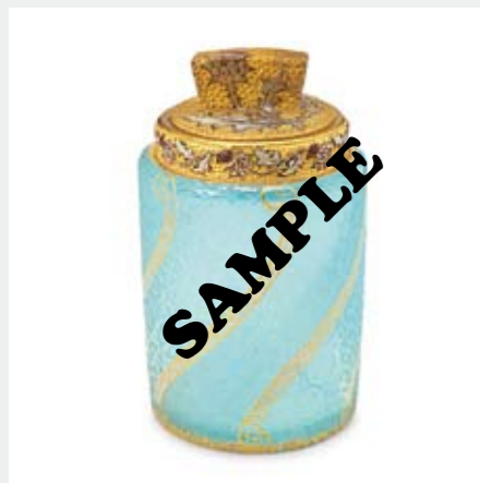
1370 ドーム 薊とローレーヌ十字文香水瓶 H9.9cm 酸化腐蝕彫り、エナメル彩、金彩 底部に金彩サイン ¥ 170,000-220,000