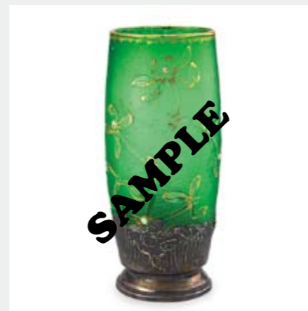
1375 ドーム ヤドリギ文グラス H14.5(金具含む)cm 酸化腐蝕彫り、エナメル彩、 金彩 底部に金彩サイン 銀製金具にホールマーク(ミネルヴァ)有 ¥ 70,000-120,000