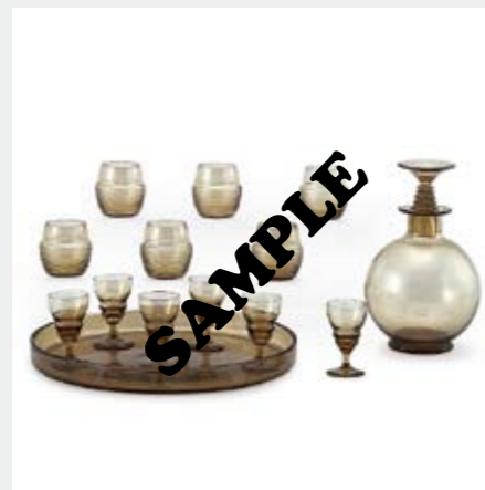
1368 ドーム [14点セット] リキュールセット デカンタ/H18.8cm グラス各種12点/H5.5-6.8cm トレイ/D26cm デカンタ以外の各底部に陰刻サイン 成り行き