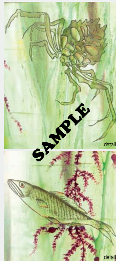
1592 ドーム 海底文花瓶 1900年頃 H39cm サリッシュユール、酸化腐蝕彫り、エナメル彩、金彩 底部に金彩サイン ¥ 1,500,000—2,000,000 参考文献 鈴木 潔(監)、 『アールヌーヴォーのガラス -北澤美術館コレクション』、 光村推古書院(刊)、1996年、P.227 Pl.305