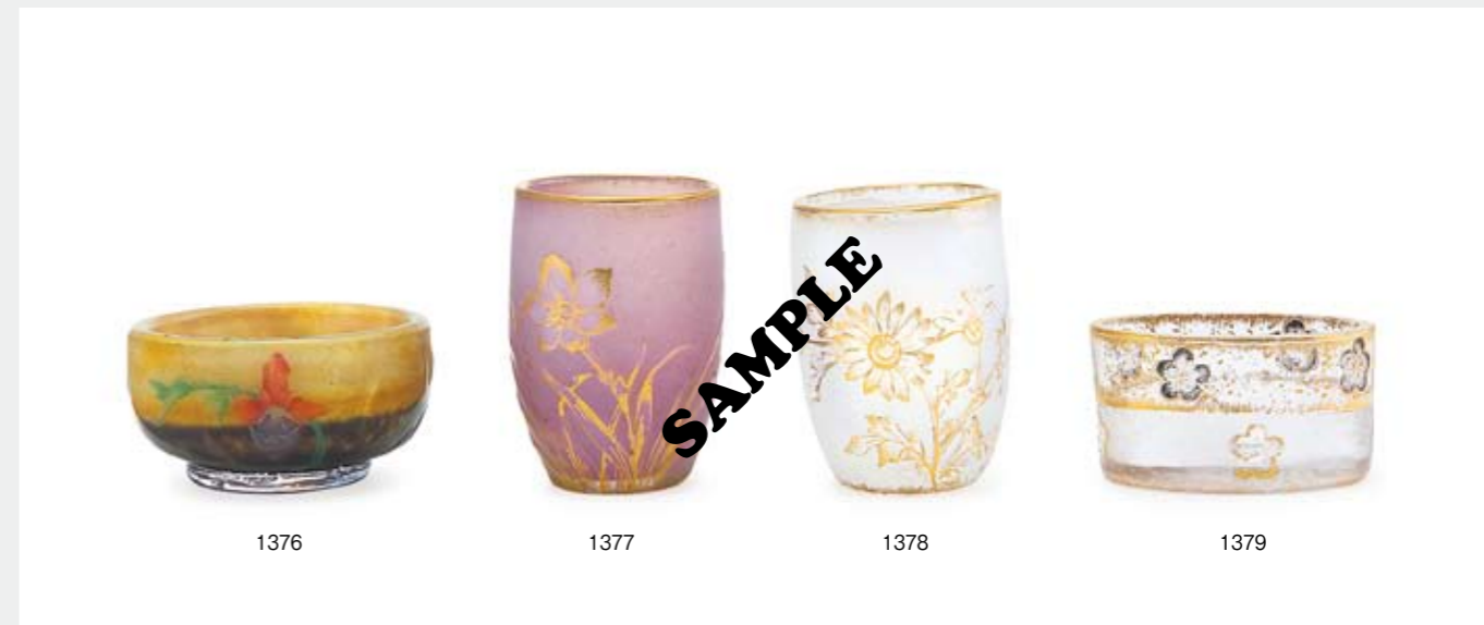
1376 ドーム ミニチュア蘭文鉢 H2.7×D5.3cm 酸化腐蝕彫り、エナメル彩 底部に陰刻サイン ¥ 90,000-140,000 1377 ドーム 水仙文グラス H5.3cm 酸化腐蝕彫り、金彩 底部に金彩サイン ¥ 30,000-50,000 1378 ドーム マーガレット文グラス H5.2cm オパールセントガラス、 酸化腐蝕彫り、金彩 底部に金彩サイン ¥ 30,000-50,000 1379 ドーム ミニチュア梅花文花器 H2.8×W5.1×3.4cm 酸化腐蝕彫り、エナメル彩、金彩 底部に金彩サイン ¥ 40,000-70,000