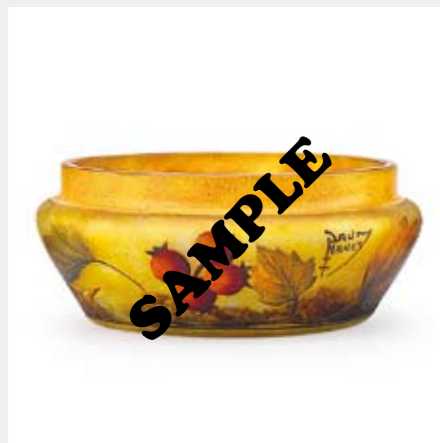
1367 ドーム スグリ文鉢 H5.6×D13.7cm ヴィトリフィカシオン、 酸化腐蝕彫り、エナメル彩 蓋欠損 側部にエナメル彩サイン 成り行き