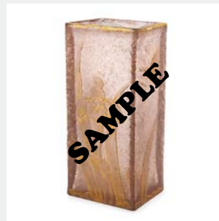
1372 ドーム 蝶とアイリス文花瓶 H18.6cm 酸化腐蝕彫り、グラヴユール、金彩 サイン摩滅 ¥ 50,000-80,000