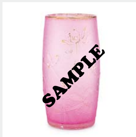
1373 ドーム ヤドリギ文グラス H12.6cm 酸化腐蝕彫り、エナメル彩、金彩 底部に金彩サイン ¥ 50,000-80,000