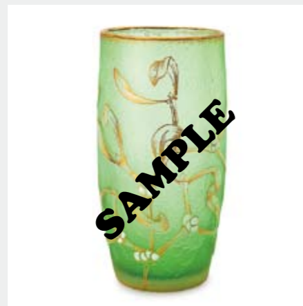
1374 ドーム ヤドリギ文グラス H12.4cm 酸化腐蝕彫り、エナメル彩、金彩 底部に金彩サイン ¥ 60,000-90,000