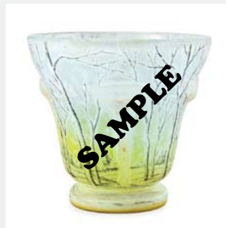
1371 ドーム 冬景色文花器 H11cm アプリカシオン、酸化腐蝕彫り、エナメル彩 底部に修復 底部にエナメル彩サイン 成り行き